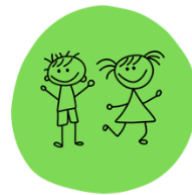
Abbildung 2: Das Kind im Mittelpunkt

Unsere Zusammenarbeit: Es wird ein von Offenheit, Wertschätzung, Toleranz, Respekt und Fairness geprägter Umgang gepflegt. Darüber hinaus unterstützen sich alle Beteiligten gegenseitig zum Wohle des Kindes.