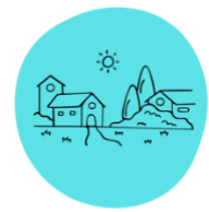
Abbildung 3: Unser Dorf als Lernumgebung

Das Kind in seiner Einzigartigkeit wird mit seinen Stärken und Schwächen gestärkt und gefördert. Soziales Miteinander und gegenseitige Rücksichtnahme bringen nicht nur seine Sozialkompetenz, sondern auch seinen Lernprozess voran.