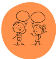
Abbildung 1: Unsere Zusammenarbeit

Die Schule Lampenberg setzt sich Leitsätze, die wesentliche pädagogische Grundsätze enthalten und Werte sowie Haltungen festlegen, die dem gegenseitigen Umgang aller an der Schule Beteiligten zugrunde liegen.